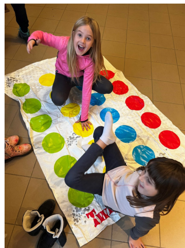
Az óvodások, iskolások fotói